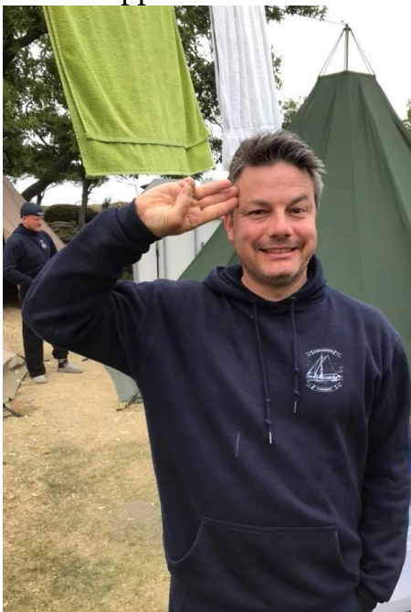
Gode ledere ved roret!